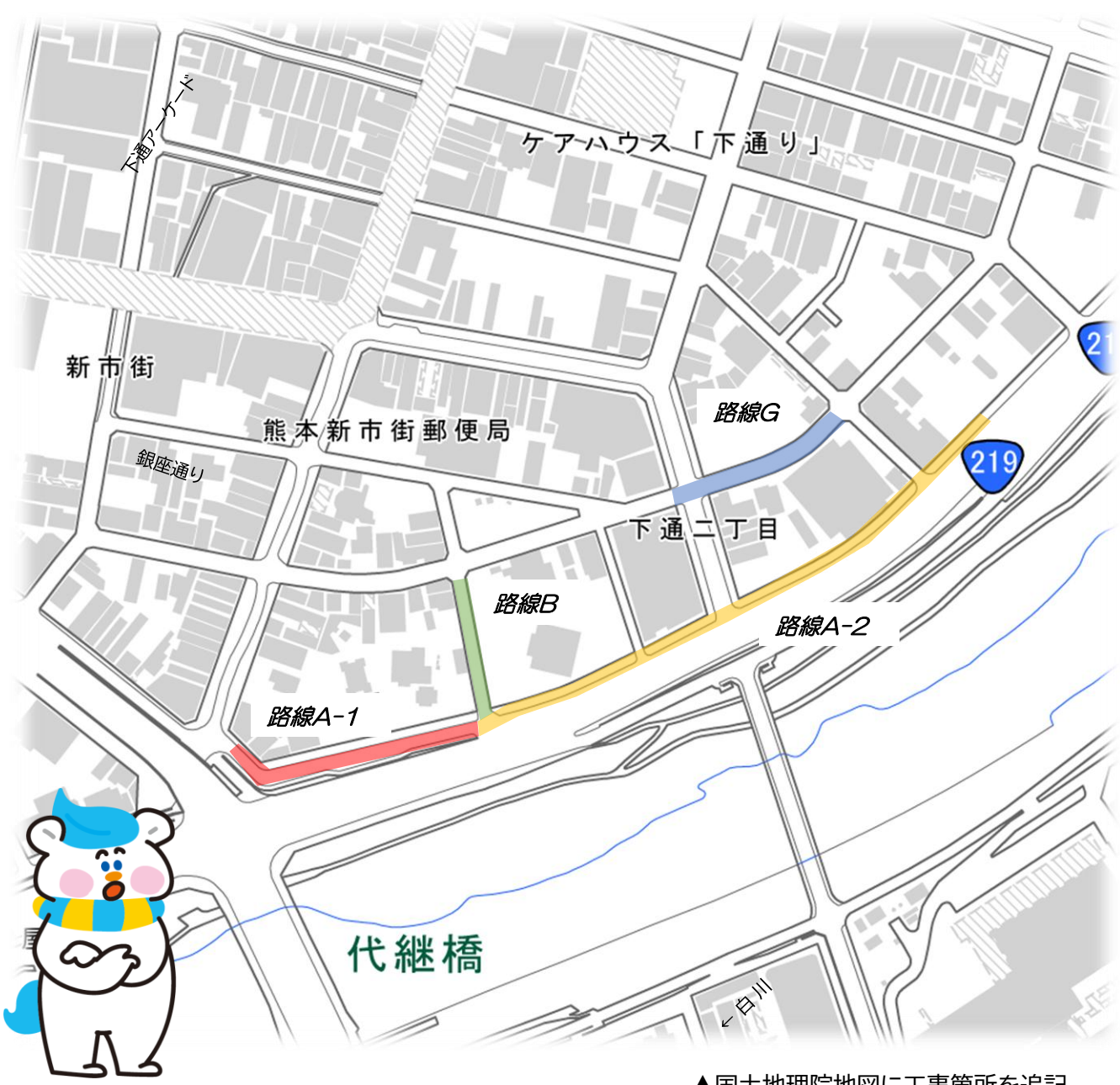
▲国土地理院地図に工事箇所を追記