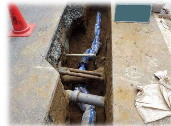
▲水道管布設後状況(路線A)