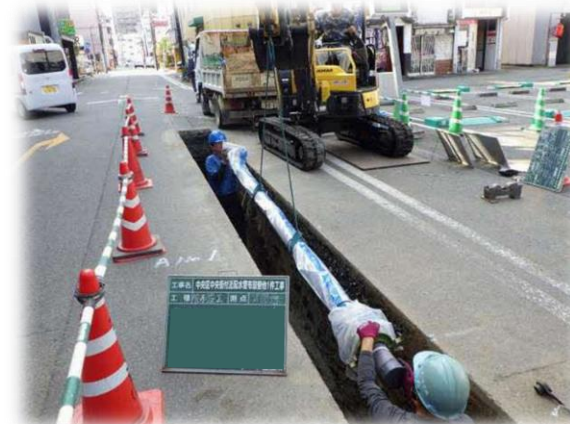
▲水道管布設工事状況(路線A)