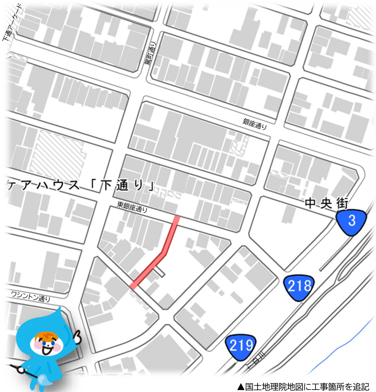
▲国土地理院地図に工事箇所を追記