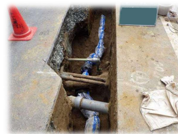
▲水道管布設後状況(路線A)