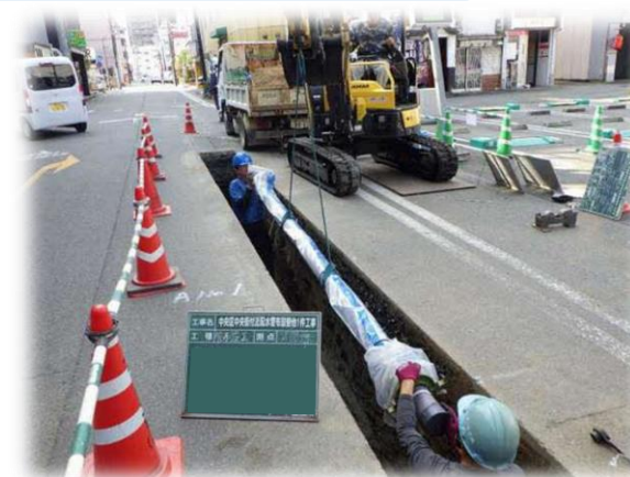
▲水道管布設工事状況(路線A)